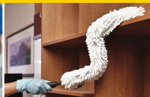
VARILLA FLEXIBLE CON FUNDA DE MICROFIBRA FGQ85200WH00