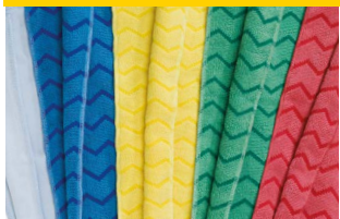
PAÑOS DE MICROFIBRA HYGEN™ FGQ62000