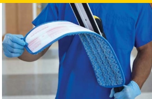
MOPA PLANA PARA TRABAJO EN HÚMEDO FGQ41000BL00