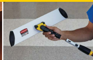
ARMAZÓN QUICK-CONNECT FGQ56000YL00