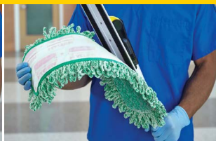
MOPA PLANA PARA TRABAJO EN SECO 1868698