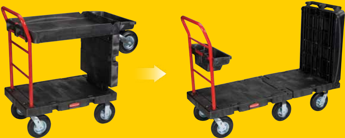
Manejo de Materiales

MÚLTIPLES CONFIGURACIONES PARA MANEJAR CUALQUIER TAREA. El diseño tres-en-uno rápidamente se transforma de un carro plataforma estándar o forma de U a un carro de dos repisas, haciendo el trabajo más eficiente al transportar cargas pesadas, herramientas y suministros con un solo producto.